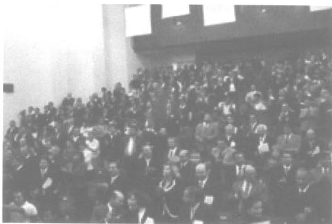
Aspecto del Auditorio José López Portillo

Formulo desde aquí mis más sinceros votos por el buen éxito de sus tareas en los próximos tres años. Muchas gracias.