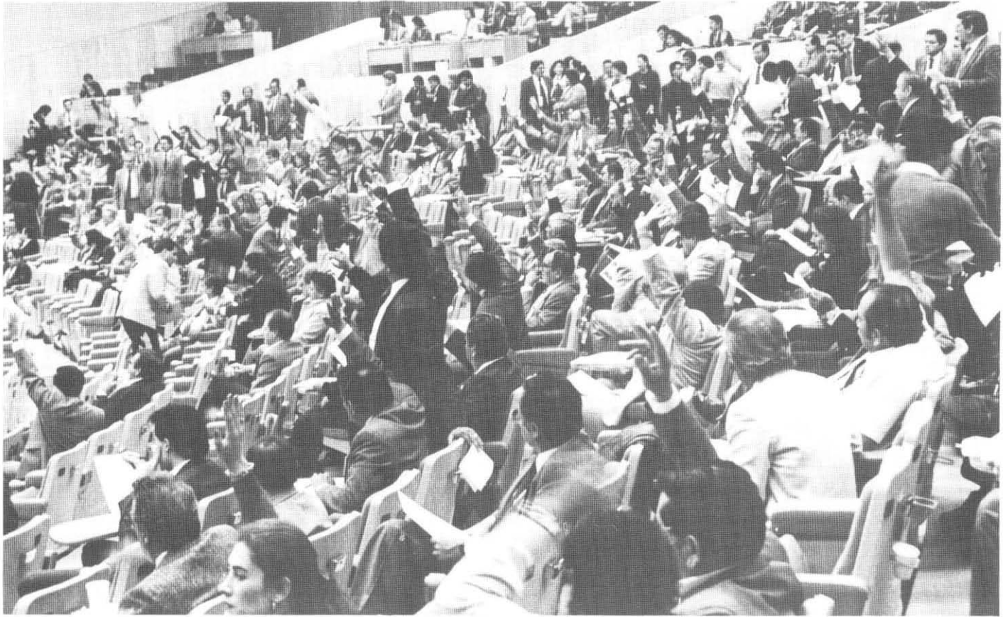
La Cámara de Diputados durante la aprobación de una iniciativa de Ley enviada por el Ejecutivo el 8 de mayo de 1990