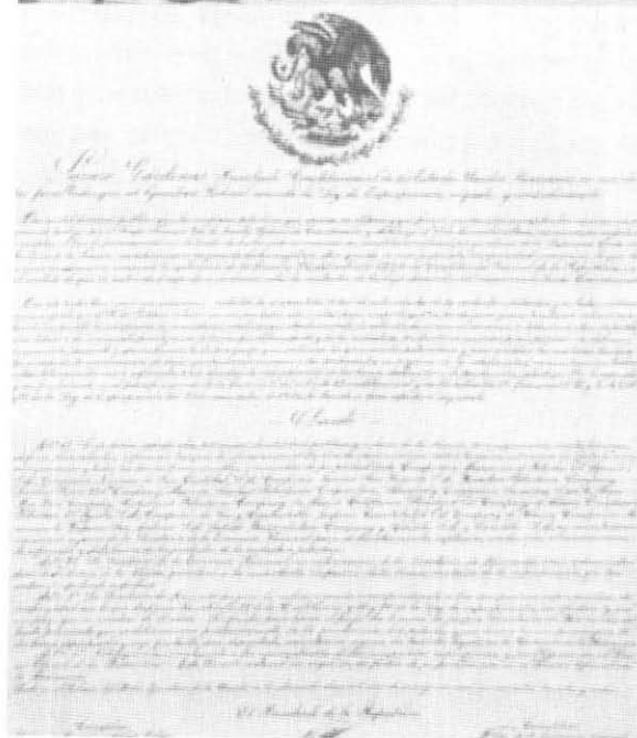
Lázaro Cárdenas emitió uno de los decretos más importantes en la historia del país: la Ley de Expropiación Petrolera