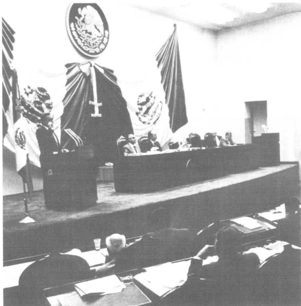
Sesión de la Comisión Permanente del Congreso de la Unión