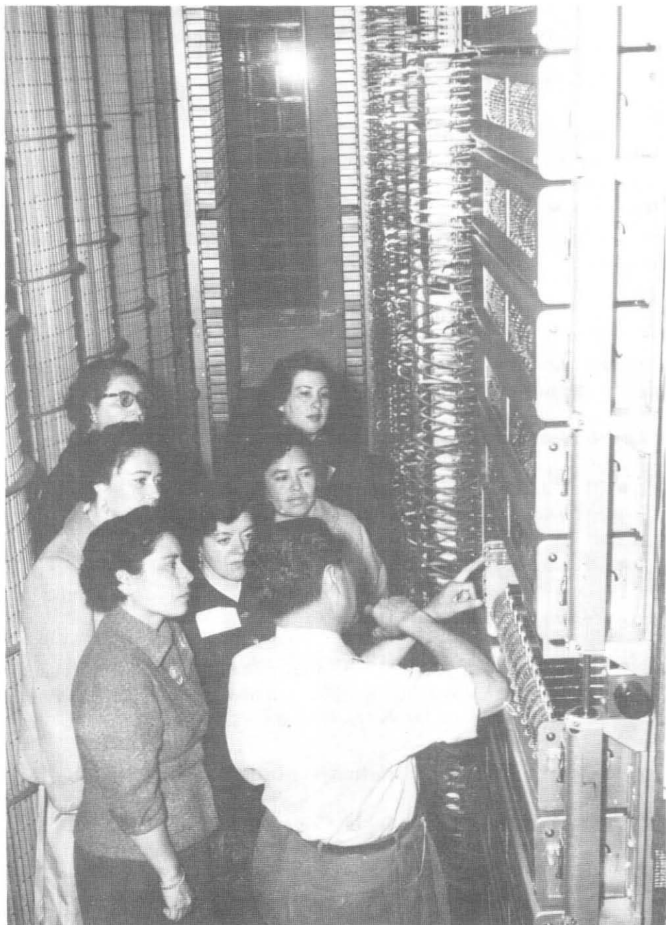
Dentro de las atribuciones de la Cámara de Diputados está la de decidir la retribución que corresponda a un empleo señalado por la ley