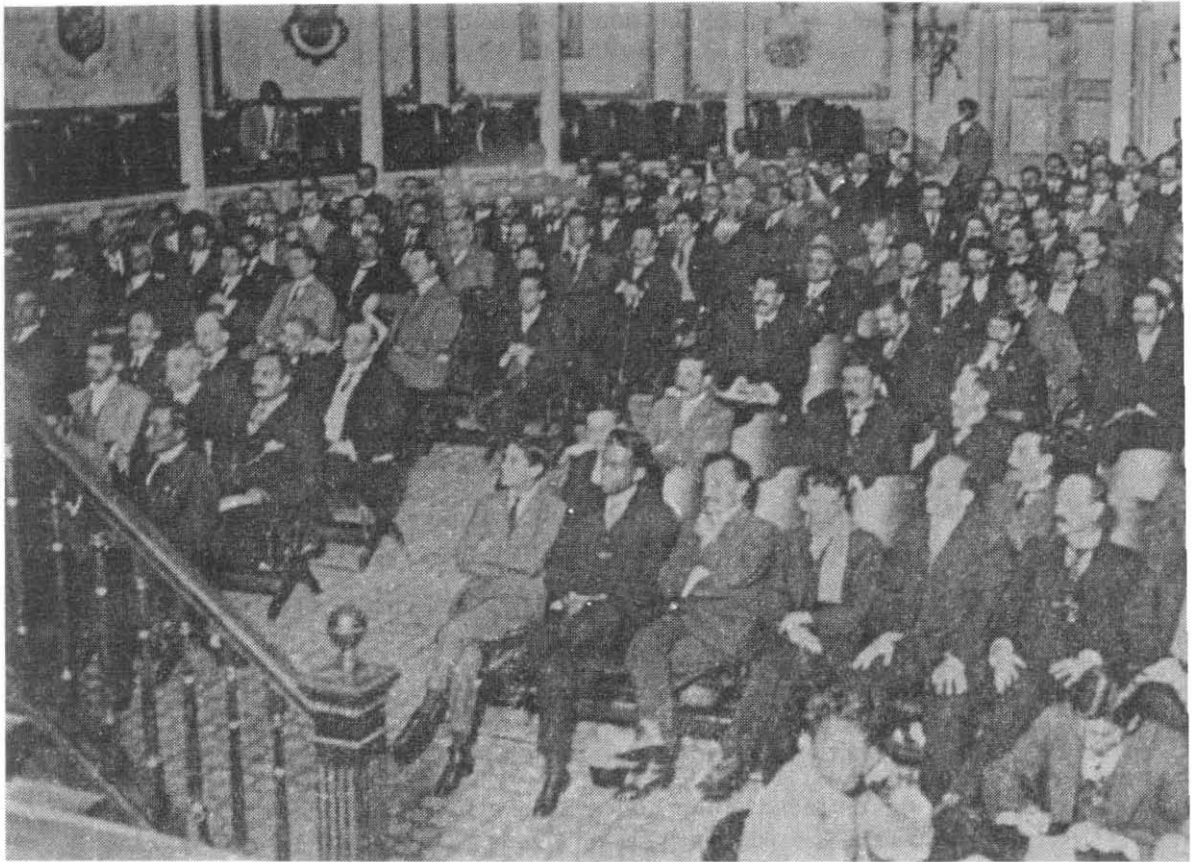
DIPUTADOS AL CONGRESO CONSTITUYENTE DE 1916-1917