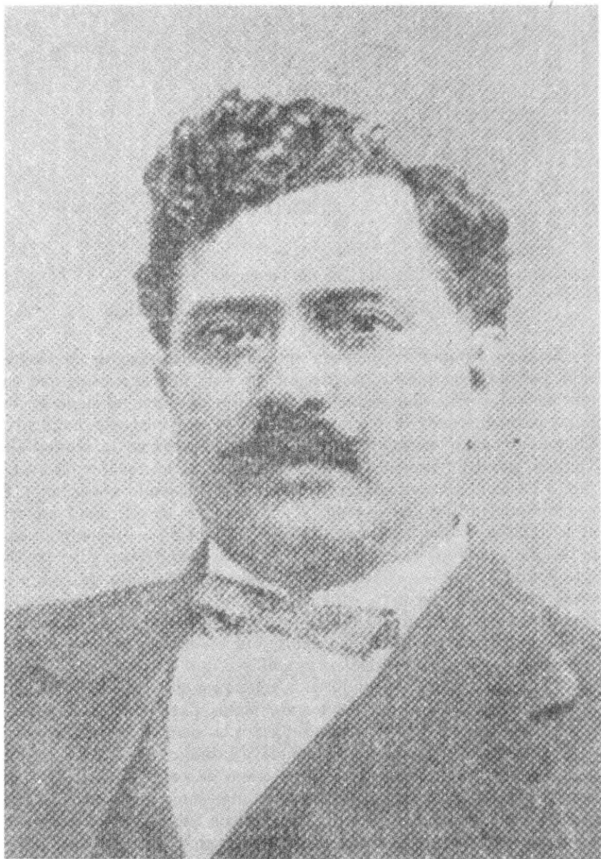
DIPUTADO CONSTITUYENTE HERIBERTO JARA