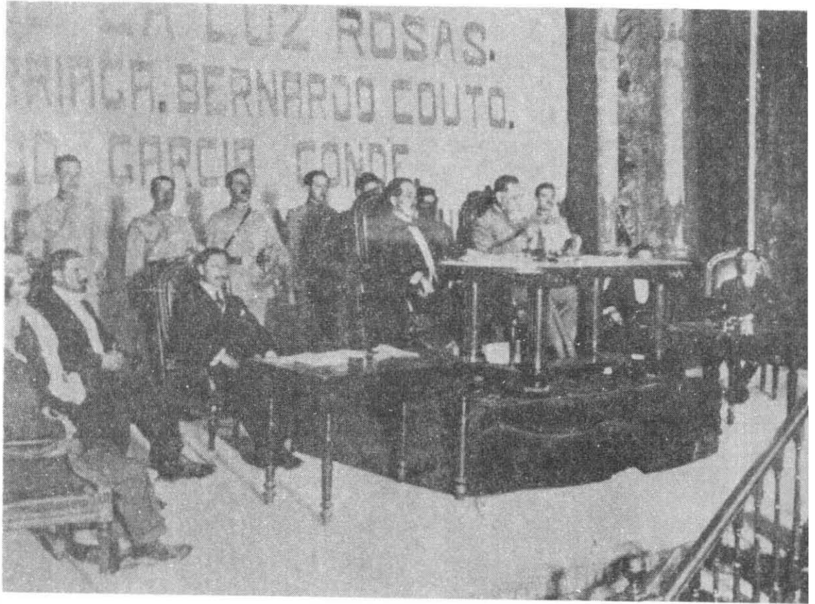
CONGRESO CONSTITUYENTE DE 1917. Sesión a la que asistió el Jefe del Ejecutivo.