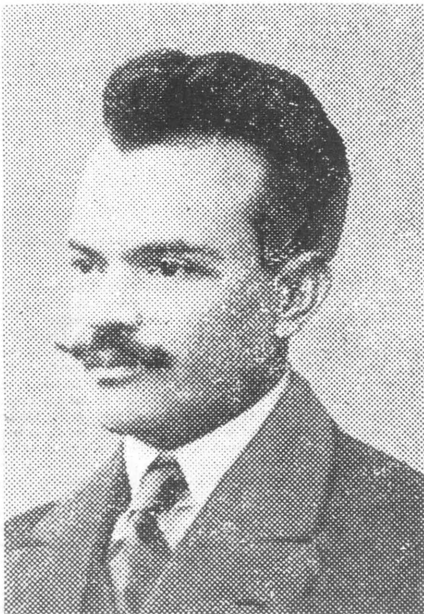
DIPUTADO CONSTITUYENTE FRANCISCO J. MÚJICA