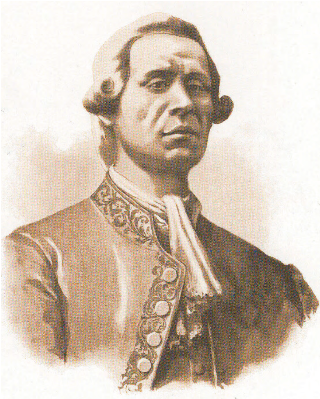
D. Francisco Primo de Verdad , grabado, s. XIX, Iconoteca de la Biblioteca Nacional- Universidad Nacional Autónoma de México.