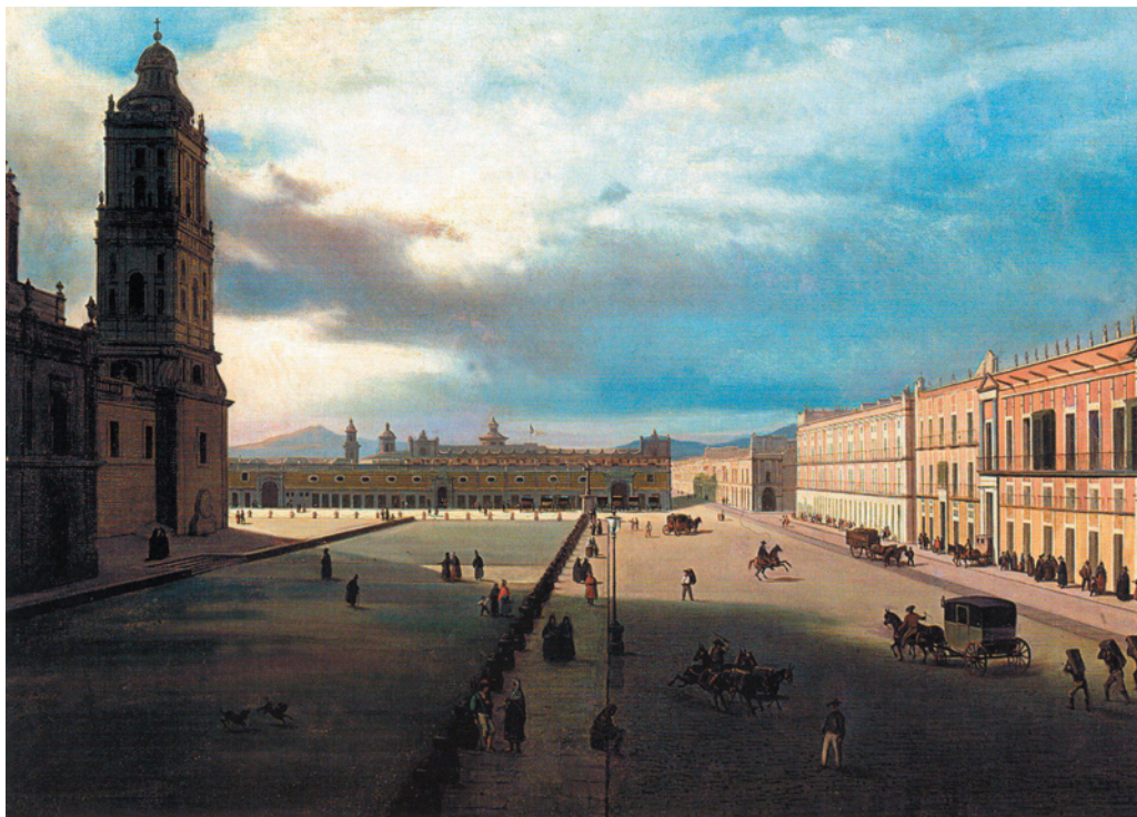
La Plaza Mayor vista desde la esquina del Monte de Piedad , óleo sobre tela, Pedro Gualdi, 1839, Museo Nacional de Historia-CONACULTA-INAH.