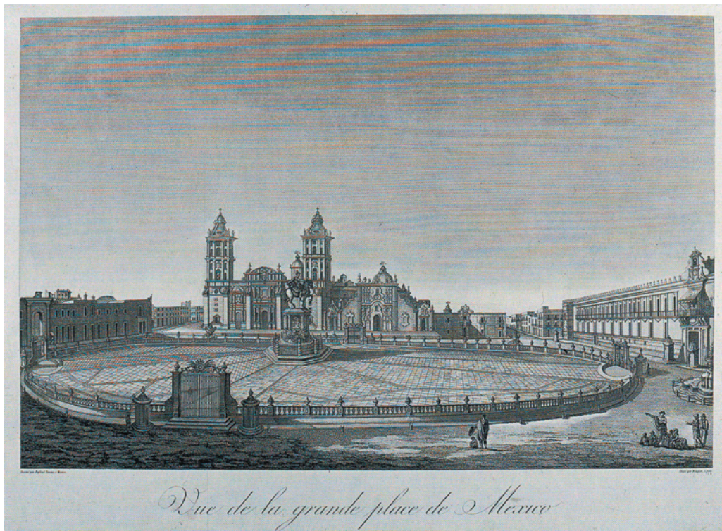
“Vista de la Plaza Mayor de México”, litografía, Raphael Ximeno, en: Voyage de Humboldt et Bonpland , París, 1813, Fondo Reservado de la Biblioteca Nacional-Universidad Nacional Autónoma de México.