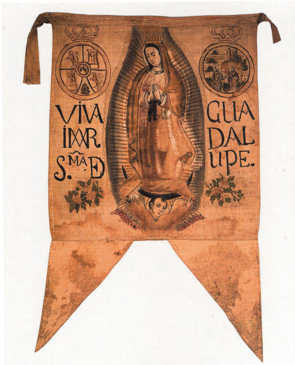
Estandarte que portó el cura Miguel Hidalgo y Costilla al inicio de la lucha de Independencia, s. XIX, Museo Nacional de Historia-CONACULTA-INAH.