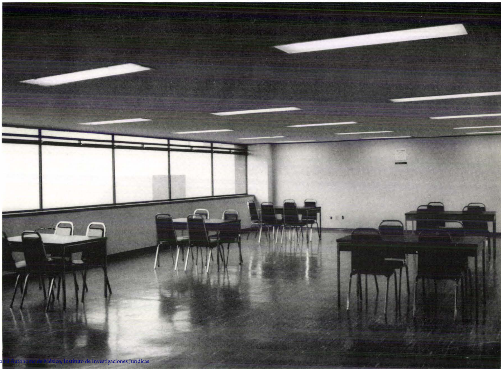
Foto 59. Centro de Documentación de Legislación y Jurisprudencia. Sala de lectura