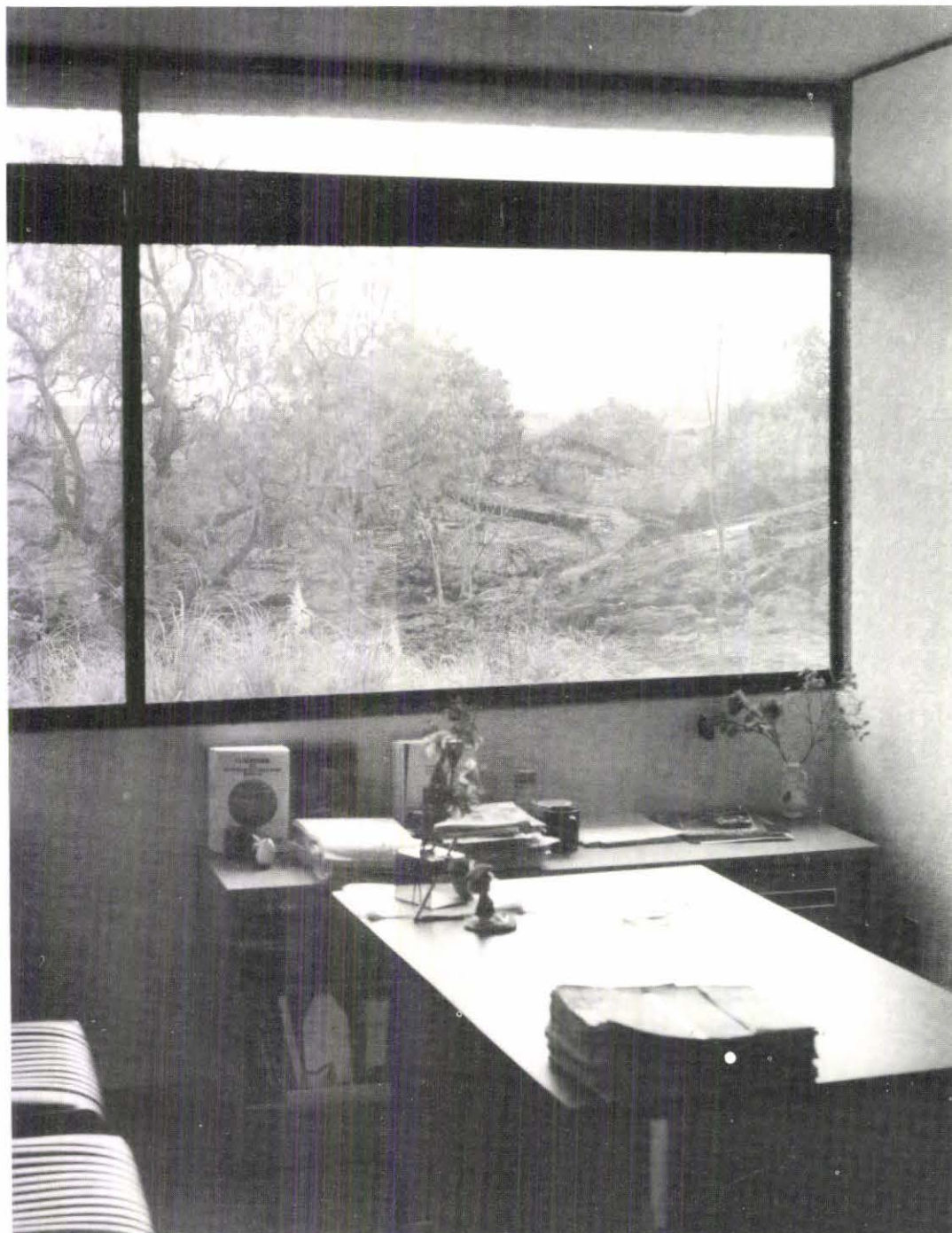
Foto 54. Cubículo de corrección

En el apartado V de esta misma obra, quedó la reproducción del catálogo de las publicaciones del Instituto en estos cincuenta años de su existencia.