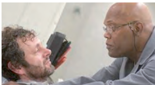
Escena de la película "Unthinkable", (2010).

las diversas instancias en posiciones encontradas pues, de un lado está el bien colectivo y del otro, el hecho de anticipar la probabilidad de ejercer violencia y tortura en contra de dos niños, situación que da nombre a la película, pues es inconcebible, llegando a tal condición que oponen a esta estrategia sugerida por el torturador material.