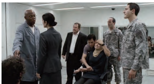
|| Escena de la película "Unthinkable", (2010). ChubbCo Film / Senator Entertainment Co / Lieju Productions

Desde luego que la acción del torturador no deja lugar a dudas de hasta dónde es capaz de llegar por lograr su objetivo, la muerte de la esposa ocurre como una demostración ante propios y extraños de la capacidad que se tiene para infligir dolor en el torturado.