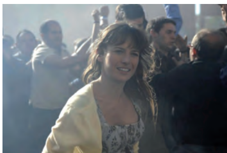
■ Escena de la película "Celda 211", (2009). Coproducción España-Francia; La Fabrique de Films /Morena Films / Telecinco Cinema / Vaca Films

que determinasen de manera clara el uso de estas armas y, aun con la existencia de estos, tanto el director como el jefe de seguridad debían saber el momento en que debían aplicarse; no obstante, Utrilla insiste en cuestionar y decir "Son ellos o nosotros" y el director reitera "hay esperar".