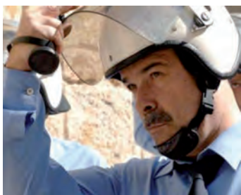
■ Escena de la película "Celda 211", (2009). Coproducción España-Francia; La Fabrique de Films/ Morena Films / Telecinco Cinema / Vaca Films

"trapicheos" a los cuáles se refería Germán? ¿si no fue así, cómo pudo entrar sin haber sido detectado?