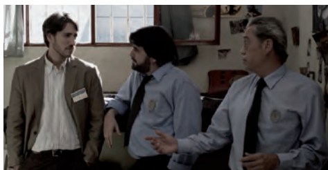
■ Escena de la película "Celda 211", (2009). Coproducción España-Francia; La Fabrique de Films / Morena Films / Telecinco Cinema / Vaca Films

las fuerzas especiales intervinieran, por miedo a que se tomaran represalias y se detonara nuevamente en el país la violencia terrorista, pero aun así la noticia se expandió e impactó en otros centros penitenciarios.