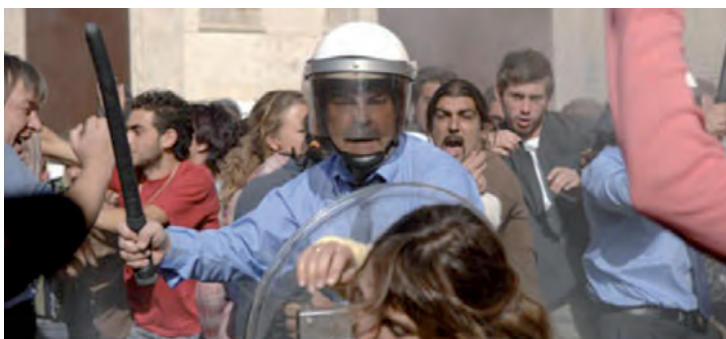
■ Escena de la película "Celda 211", (2009). Coproducción España-Francia; La Fabrique de Films /Morena Films / Telecinco Cinema / Vaca Films

consejo técnico, además, de acuerdo a lo previsto por la Recomendación General 22/2015 Sobre las prácticas de aislamiento en los Centros Penitenciarios de la República Mexicana, emitida por la CNDH, un aislamiento por más de 15 días es considerado como prolongado y debe ser considerado "contrario al fin de la pena de prisión, en virtud de que no posibilita las mejores condiciones para una vida digna en reclusión, pues esta condición puede resultar lesiva a la integridad física, psíquica y moral de la persona". 76