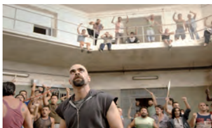
■ Escena de la película "Celda 211", (2009). Coproducción España-Francia; La Fabrique de Films / Morena Films / Telecinco Cinema / Vaca Films

autoridades penitenciarias debían haberlo anticipado, atendiendo las citadas deficiencias, pero fueron omisos y las consecuencias de esa falta de atención dieron como resultado una nueva revuelta.