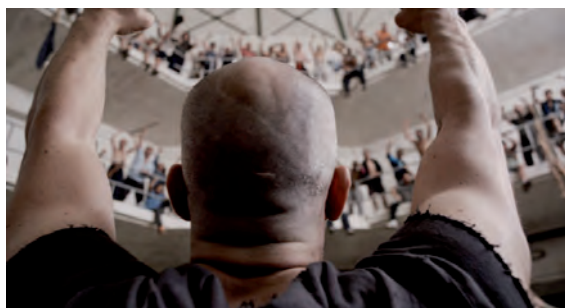
■ Escena de la película "Celda 211", (2009). Coproducción España-Francia; La Fabrique de Films /Morena Films / Telecinco Cinema / Vaca Films

su conducta violenta. Utrilla es apodado por los internos como "el puta vieja" por su gusto por golpear a la gente. Cuando Juan se entera que él ha sido quien hirió a Elena, los amotinados lo mandan llamar para que sea él quien negocie con ellos, argumentando que no quieren a nadie más "que si deben hablar con un hijo de puta, mejor uno conocido" y el director accede, lo manda llamar de vuelta para vaya con ellos a negociar; sin embargo las autoridades debían anticipar (dado su historial impulsivo) que había el riesgo de que lo mataran y aun así lo mandan con ellos.