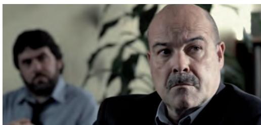
III Escena de la película "Celda 211", (2009). Coproducción España-Francia; La Fabrique de Films / Morena Films / Telecinco Cinema / Vaca Films

¿Pero quién les facilitó esa información? ¿Cómo sabían que aún se encontraban ahí los etarras? ¿De algún lado debió salir el dato? Incluso el director del centro ignoraba que no se les había trasladado ya, Armando le hace saber que siguen ahí y cuando estaban dispuestos los GEA a esta información lo cambia todo: ¿Cómo lo supieron los internos?