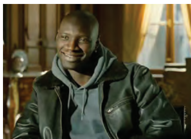
■ Escena de la película "Untouchable", (2011). Quad Productions / Gaumont / TFI Films / Ten Films / Chaocorp production / Canal + / Cinéma

La disposición de Driss ante cualquier reto este se presentó con la pregunta de Philippe: "¿estás dispuesto a un mes de prueba para trabajar?" Y por parte de Philip-