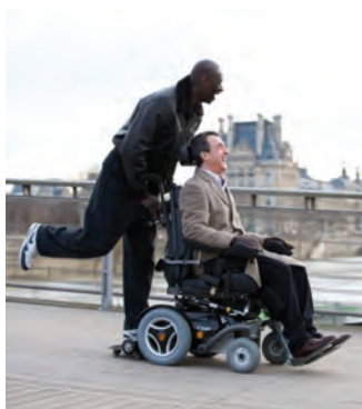
■ Escena de la película "Intouchables", (2011). Quad Productions / Gaumont / TF1 Films / Ten Films / Chaocorp production / Canal + / Cinéma

algo que les hizo ir creando una empatía, el alejarse de toda su historia y darse la oportunidad de construir cada día algo diferente; por un lado Phillippe se dejó impresionar por la vitalidad y ocurrencias de Driss, ya que éste le decía que, pese a su inmovilidad física, era capaz de crear otros conceptos totalmente diferentes, de las cosas más simples como reírse de la vida. Esto permitió que Driss ocupara un lugar de respeto tanto por su empleador como todos los que trabajaban para Phillippe y que fuera tratado como a cualquier otro ser humano sin ser percibido constantemente como una amenaza o un ex, convicto.