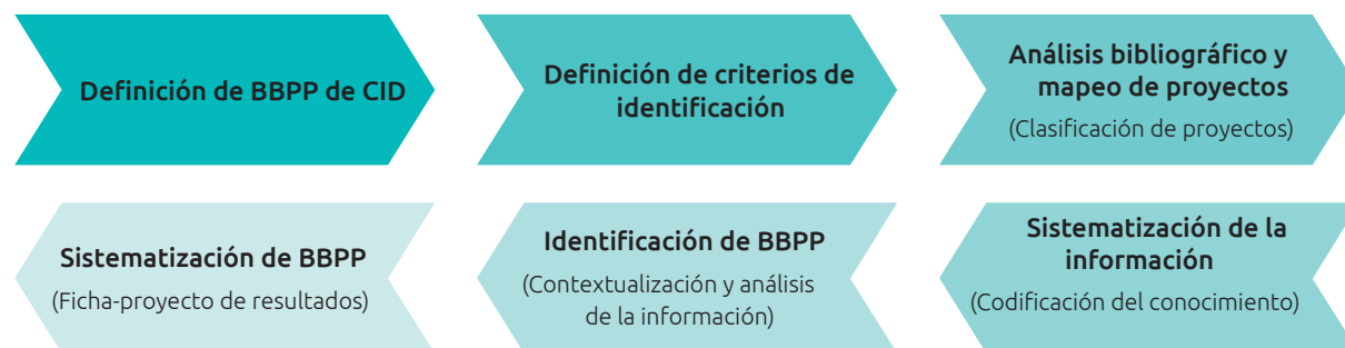
DIAGRAMA SECUENCIAL DE LA SISTEMATIZACIÓN DE BBPP DE CID