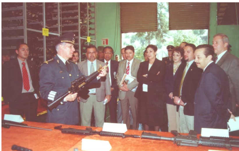
EXPLICACIÓN DEL FUNCIONAMIENTO DEL DEPOSITO DE ARMAMENTO DECOMISADO