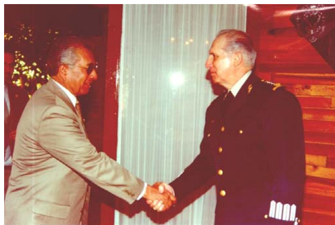
ARRIBO Y RECEPCIÓN POR EL C. GRAL SECRETARIO DE LA DEFENSA NACIONAL RICARDO CLEMENTE VEGA GARCÍA

Esta visita permitió constatar el nivel de disciplina, organización, adiestramiento y equipo de una parte representativa del Ejército y Fuerza Aérea Mexicanos y aportó información que será de utilidad para los trabajos legislativos de la Comisión de Defensa Nacional.