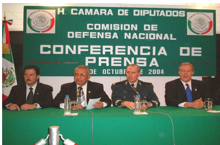
CONFERENCIA DE PRENSA