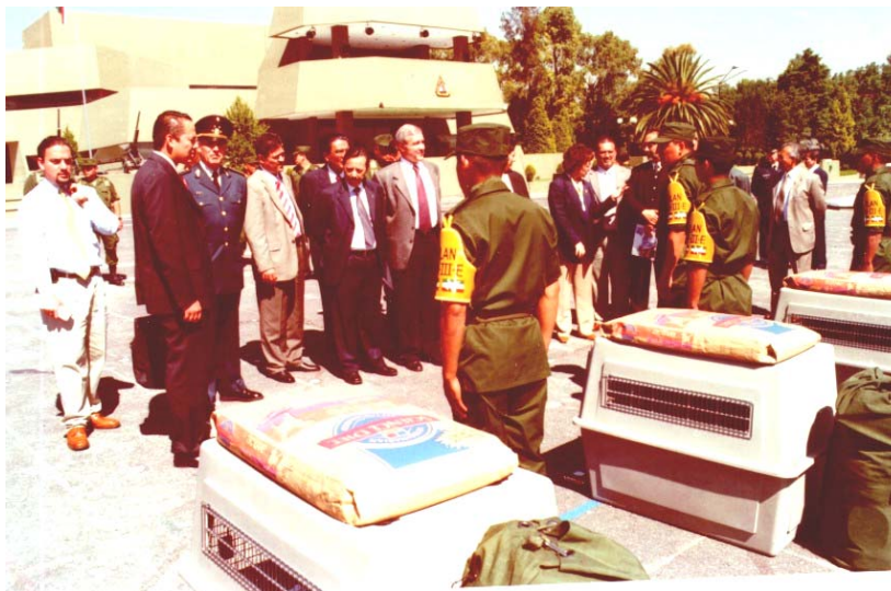
PRESENTACIÓN DE LA F.A.C.D. EN LA EXPLANADA "DAMIÁN CARMONA"