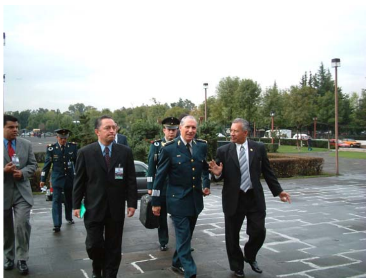
ARRIBO DEL GENERAL SECRETARIO DE LA DEFENSA NACIONAL

Al término de la comparecencia se ofreció una conferencia de prensa donde participaron representantes de los medios de comunicación.