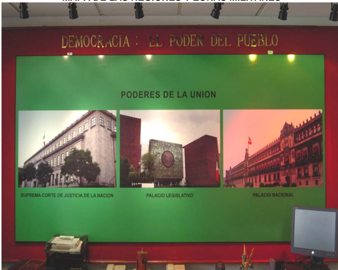
CUADRO CON LAS FOTOGRAFÍAS DE LAS INSTALACIONES PRINCIPALES DE LOS PODERES DE LA UNIÓN