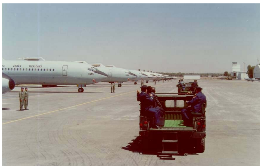
EXPOSICIÓN ESTÁTICA DE AVIONES HÉRCULES C-130 Y B-727