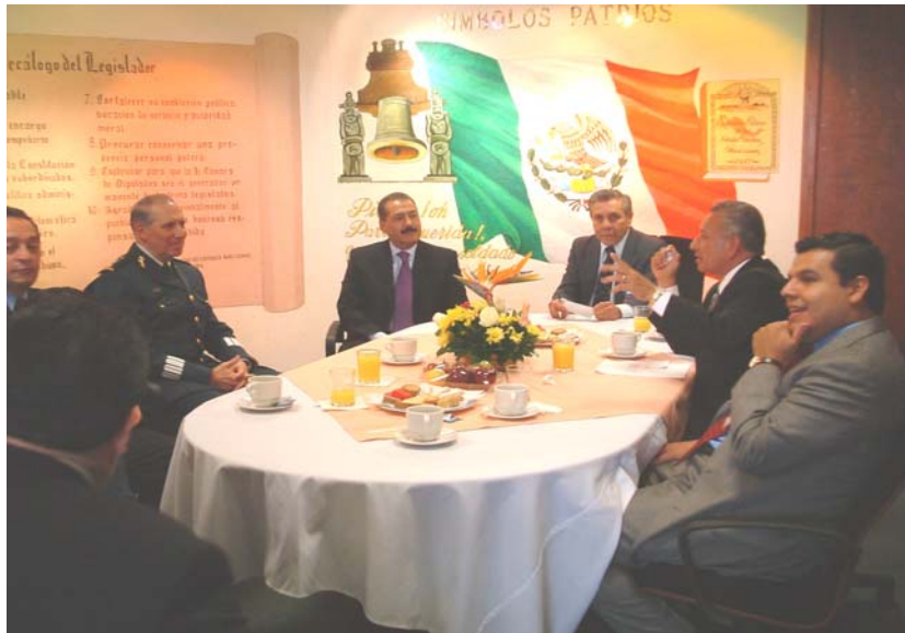
EN LAS OFICINAS DE LA COMISIÓN