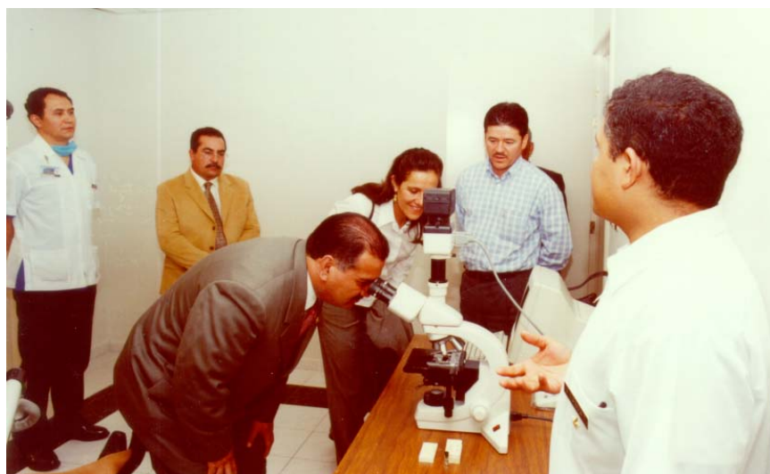
VISTA AL MICROSCOPIO