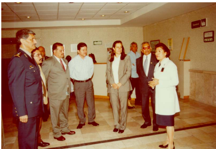
RECORRIDO POR EL DEPARTAMENTO DE RAYOS X

Tanto el arribo como la despedida se efectuaron en la Secretaría de la Defensa Nacional