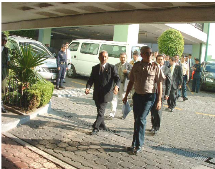
ARRIBO A INSTALACIONES