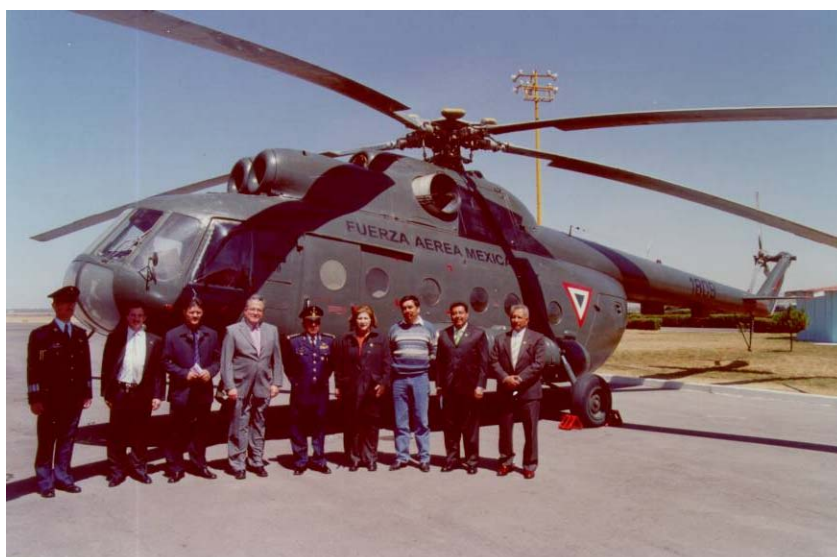
PRESENTACIÓN Y FUNCIONAMIENTO DEL EDN. AÉREO 303