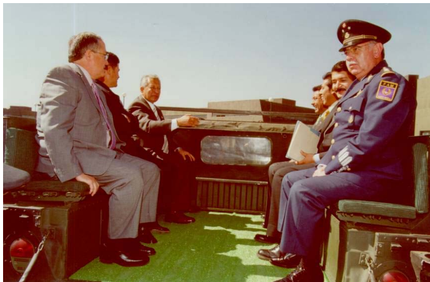
ABORDAJE DE VEHÍCULOS