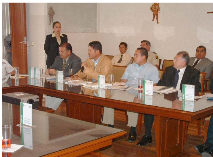
SESIÓN DE PREGUNTAS Y RESPUESTAS