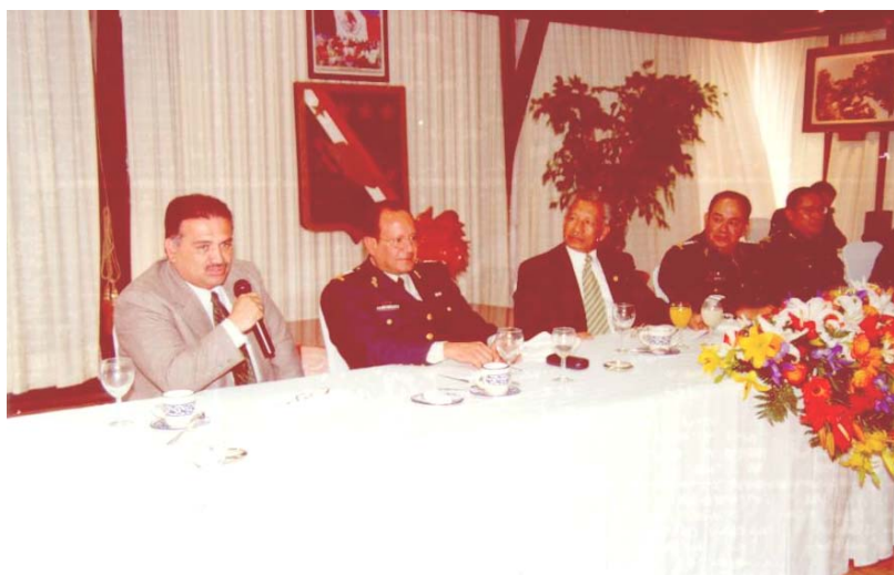
SESIÓN DE PREGUNTAS Y RESPUESTAS