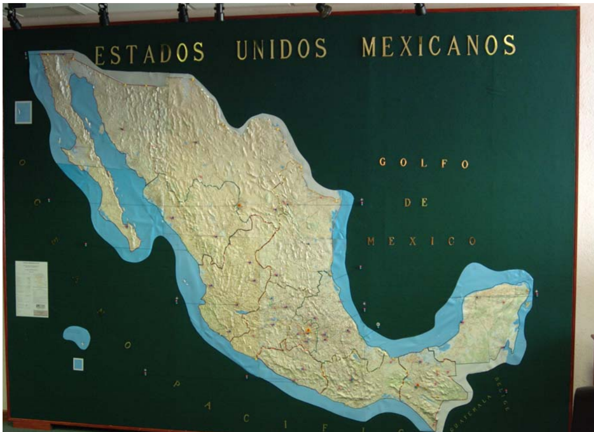
MAPA DE LAS REGIONES Y ZONAS MILITARES