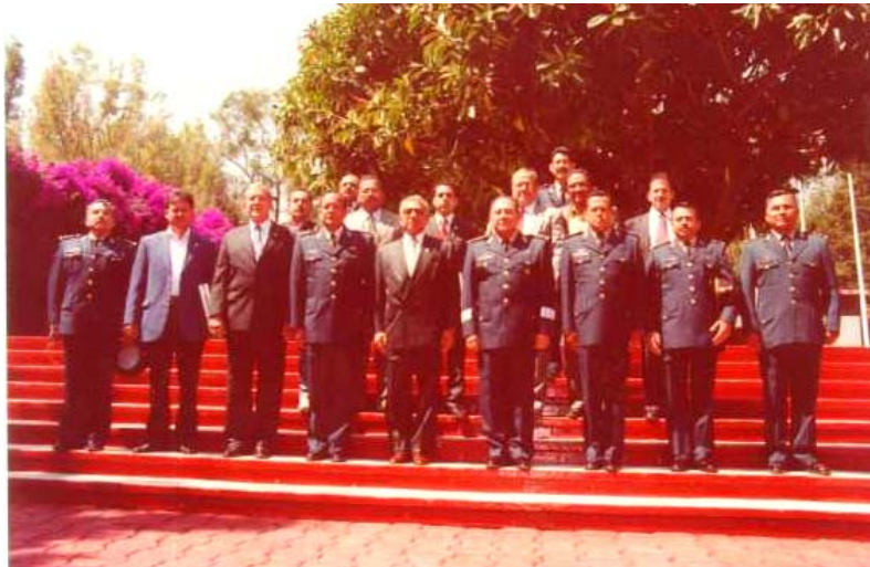
ASISTENTES A LA REUNIÓN

El Presidente de la Comisión Agregó que en el ejercicio del mando está la justicia militar. Señaló que esta reunión facilitará el trabajo legislativo y que estos encuentros constatan sin intermediarios la situación real que prevalece en el Instituto Armado.