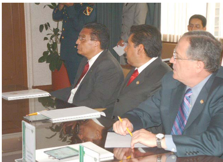
BIENVENIDA POR PARTE DEL C. GRAL. DIV. TOMÁS ÁNGELES DAUAHARE, DIRECTOR GENERAL DEL INSTITUTO Y EXPOSICIÓN