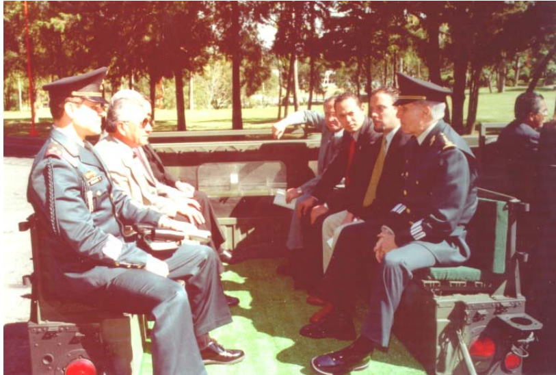
ABORDO Y TRASLADO A LA BRIGADA DE FUSILEROS PARACAIDISTAS