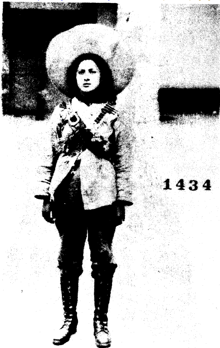
Mujeres en la Revolución, México, AGN, Propiedad artística y literaria, HN. Gutiérrez, Revolución 24, 93, V. 124. Fot.