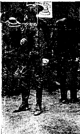
El Sr. Carranza en la revolución de 1914.

7º Para el establecimiento del Gobierno Constitu-