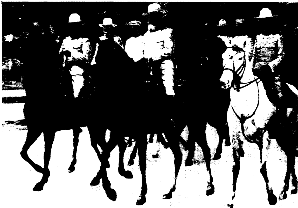
Entrada a la Ciudad de México del primer jefe el 20 de agosto de 1914. A su derecha lo acompaña el general Álvaro Obregón y a su izquierda el general Antonio I. Villarreal. En segundo término y de izquierda a derecha, se ven los generales Plutarco Elías Calles, Salvador Alvarado, Cesáreo Castro, Manuel M. Diéguez, Cándido Aguilar, Francisco Murguía, Benjamín Hill, Jesús Agustín Castro, Francisco Coss, y otros